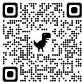
Kod QR Lokalizacji

Dom Ludowy, budynek Gminnej Biblioteki Publicznej im. Władysława Stanisława Reymonta w Wierzchosławicach, 1 piętro