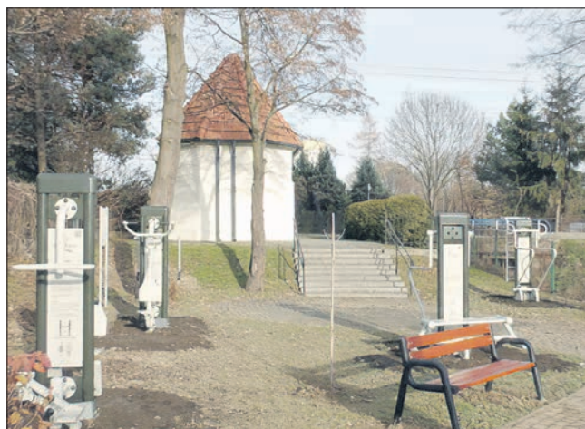
Siłownia plenerowa w Bogumiłowicach

W miejscowości Bogumiłowice została wykonana siłownia plenerowa dzięki dotacji celowej z budżetu Województwa Małopolskiego w ramach projektu „ Małopolska infrastruktura rekreacyjno-sportowa - MIRS ” w 2022 roku. Inwestycja ta obejmuje następujące urządzenia siłowni plenerowej: ławka prosta + poręcz, prasa nożna + stepper, drabinka + poręcz, prasa ręczna + wyciąg górny oraz ławki, kosz na śmieci, stojak na rowery i tablice informacyjne. Całość inwestycji kosztowała 26 900,00 zł z czego budżet gminy pokrył blisko połowę (ok 13 tys. zł).