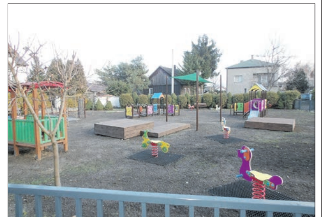
Plac Zabaw przy Przedszkolu Publicznym w Wierchosławicach