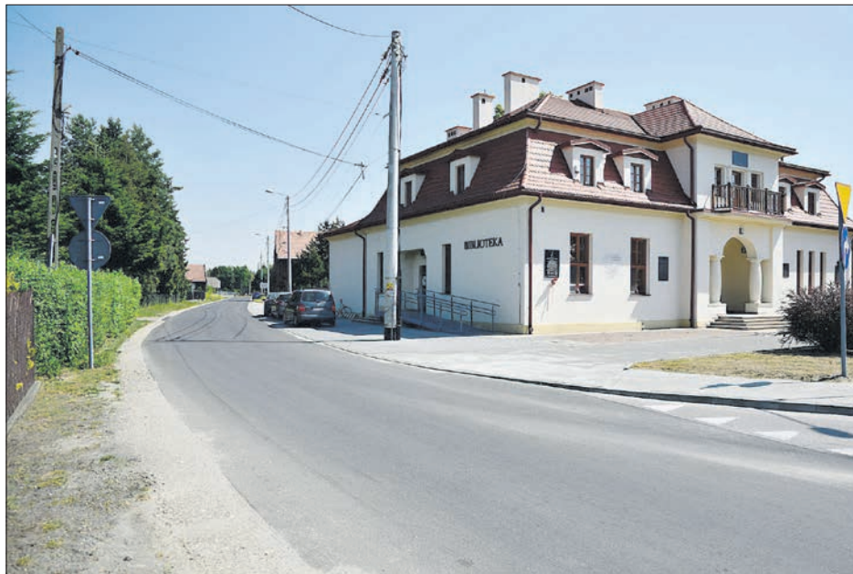
Droga na Wolę

Zarząd Województwa Małopolskiego przyznał