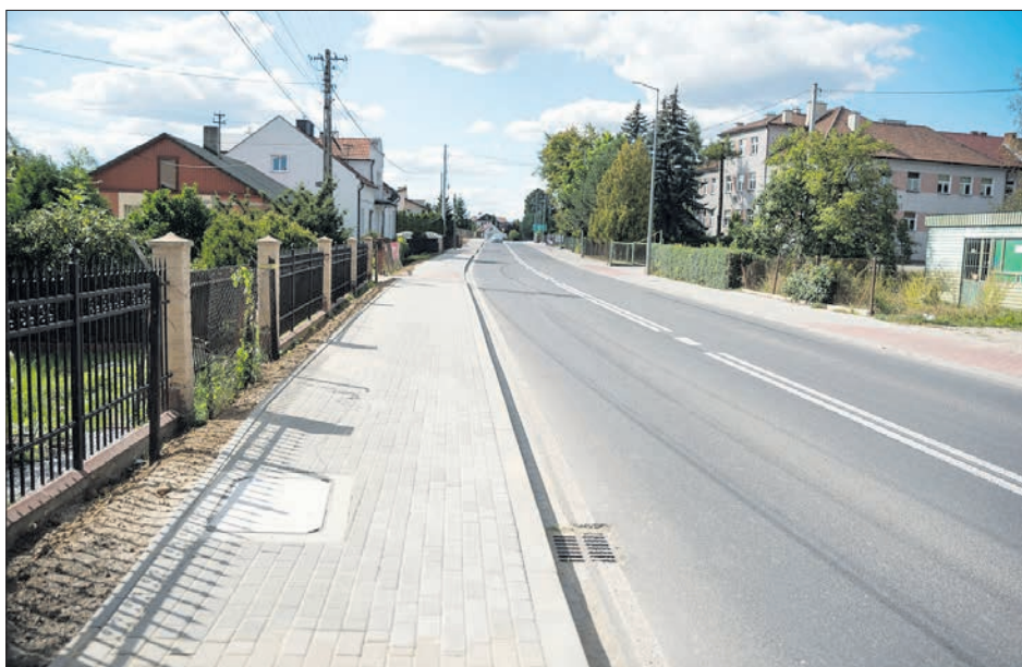
Chodnik w ciągu DW 975 oddany do użytku