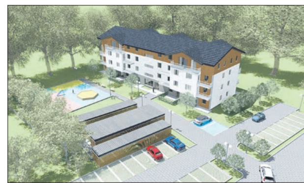
Wizualizacja budynku mieszkalnego na Dwudniakach

W ramach SIM Małopolska, planowana jest budowa aż 955 mieszkań! Mają one być alternatywą dla osób i rodzin o niskich dochodach oraz małej zdolności kredytowej. Mieszka-