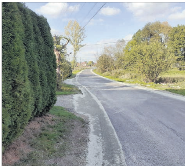
Zakończono prace remontowe drogi gminnej transportu rolniczego w miejscowości Gosławice

Wartość prac wyniosła 555 014,75 zł, z budżetu gminnego do realizacji inwestycji dołożono ponad 300 000zł.