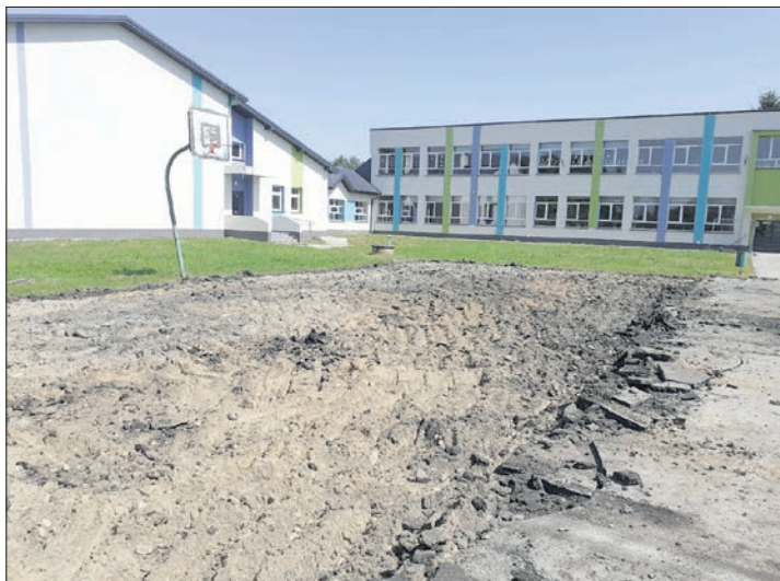
Budowa boiska w Rudce przy Szkole Podstawowej w ramach inwestycji „Sportowa Polska 2022”