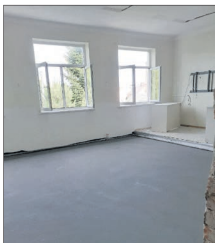
Remont i modernizacja Szkoły Podstawowej w Wierzchosławicach w ramach Polskiego Ładu