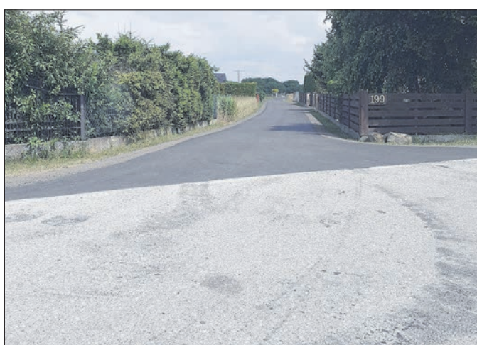
Modernizacja infrastruktury drogowej w miejscowościach Gminy Wierzchosławice-Polski Ład – Remont i modernizacja drogi gminnej w miejscowości Bogumiłowice