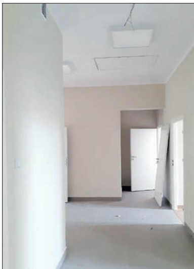
Remont i modernizacja szkoły Podstawowej w Ostrowie w ramach Polskiego Ładu-Budynek I