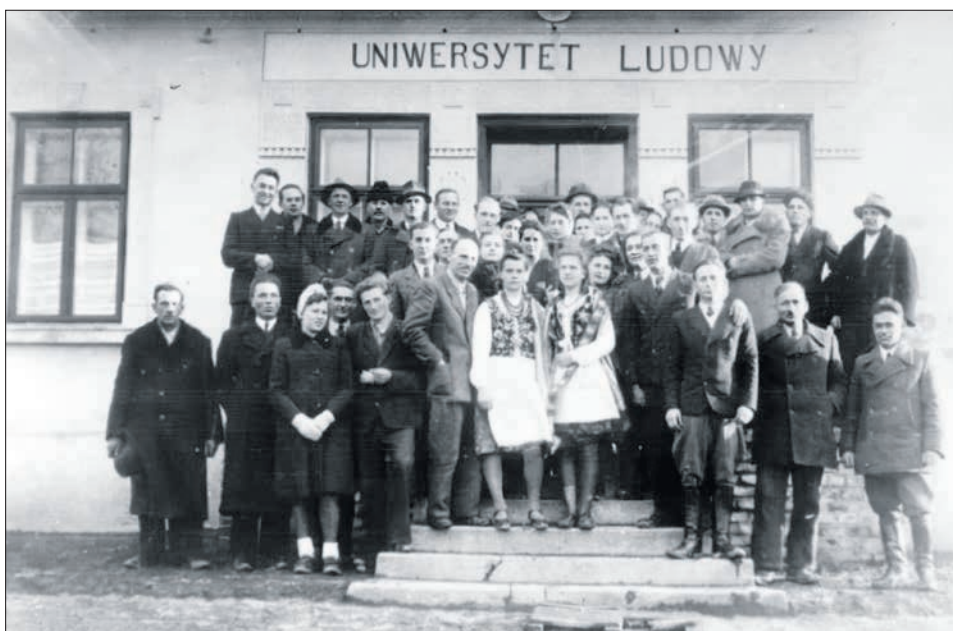
Absolwenci pierwszego kursu Uniwersytetu Ludowego w Wierzchosławicach.