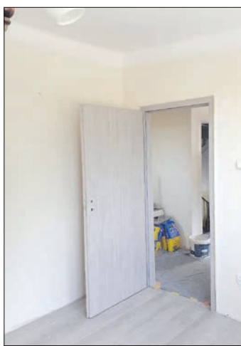
Remont mieszkania komunalnego w Mikołajowicach.

Ponadto Zarząd Województwa Małopolskiego przeznaczył dla Gminy Wierzchosławice dotację w kwocie 9 000,00 zł w konkursie „Kapliczki Małopolski 2023” na zadanie pn.: Konserwacja kapliczki Matki Bożej Różaniec z 1907 roku w miejscowości Komorów. ■