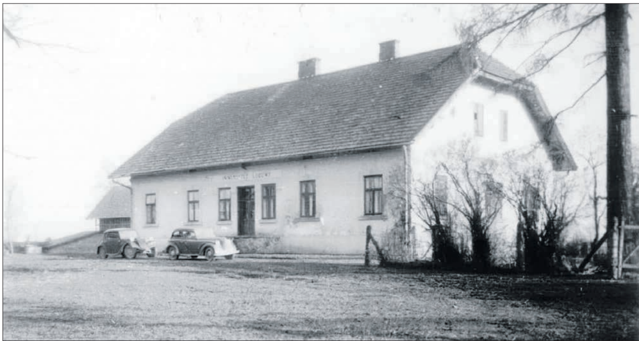
Pierwszy budynek Uniwersytetu Ludowego w Wierzchosławicach.