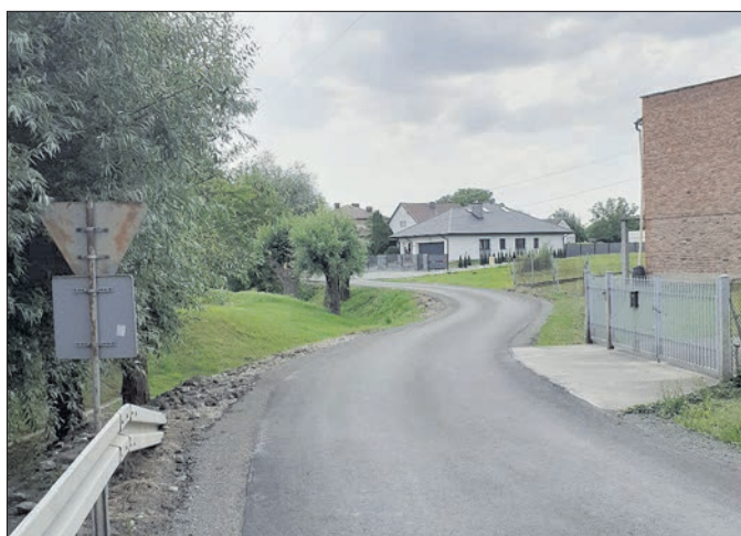
Modernizacja infrastruktury drogowej w miejscowościach Gminy Wierzchosławice-Polski Ład – Droga gminna K202519 Ostrów