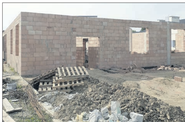
Rozbudowa szkoły Podstawowej w Szkole Podstawowej w Rudce w ramach Polskiego Ładu.