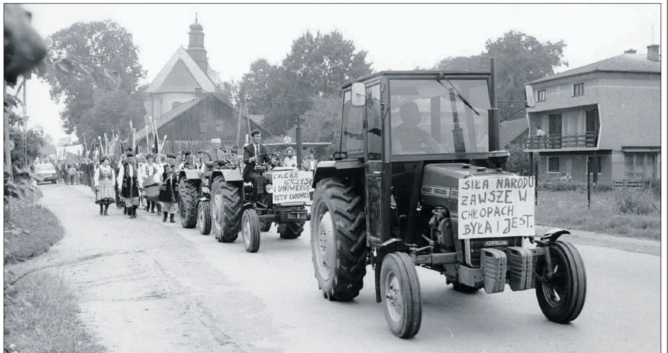
Uczestnicy strajku okupacyjnego w drodze do Uniwersytetu Ludowego, 13 sierpnia 1989 r.