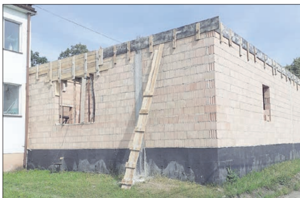
Rozbudowa szkoły Podstawowej w Szkole Podstawowej w Łętowicach w ramach Polskiego Ładu.