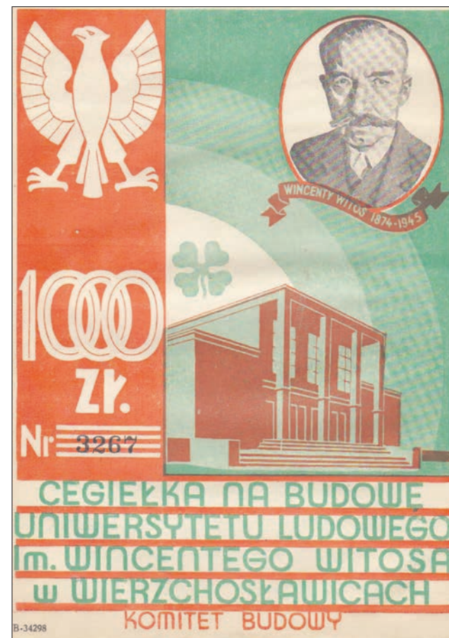
Cegiełka na budowę Uniwersytetu Ludowego im. Wincentego Witosy w Wierzchosławicach.

W prawym skrzydle budynku znajdowało się mieszkanie dla dozorczy złożone z pokoju i kuchni, przedpokoju, dwa pokoje mieszkalne, izba chorych i składzik. Na pierwszym piętrze, na które prowadziły schody rozplanowano aulę oraz salę wykładową. Po przeciwnej stronie usytuowano czytelnia. Oba skrzydła pierwszego piętra przeznaczone były na pokoje internatu składające się z 6 pokoi. Tylną część obydwu skrzydeł łączyła oszklona galeria budynku. Kuchnie, magazyny, natryski, składy i kotłownię umieszczono w suterynie.