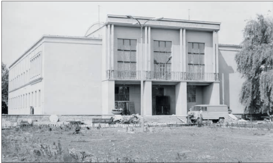
Uniwersytet Ludowy w Wierzchosławicach, lata 70 XX wieku.

Wprowadzono kurs księgowości a dla chłopców naukę jazdy na traktorze. Dla dziewcząt dodatkowo przewidziano kursy kroju i szycia oraz gospodarowania domowego. Od września 1974 r. wprowadzono cieszące się dużym powodzeniem roczne pomaturalne kursy dla organizatorów życia społeczno-kulturalnego. Absolwenci uzyskiwali uprawnień zawodowe na poziomie średnim w zakresie pracy kulturalno- oświatowej. Dużą popularnością wśród uczniów