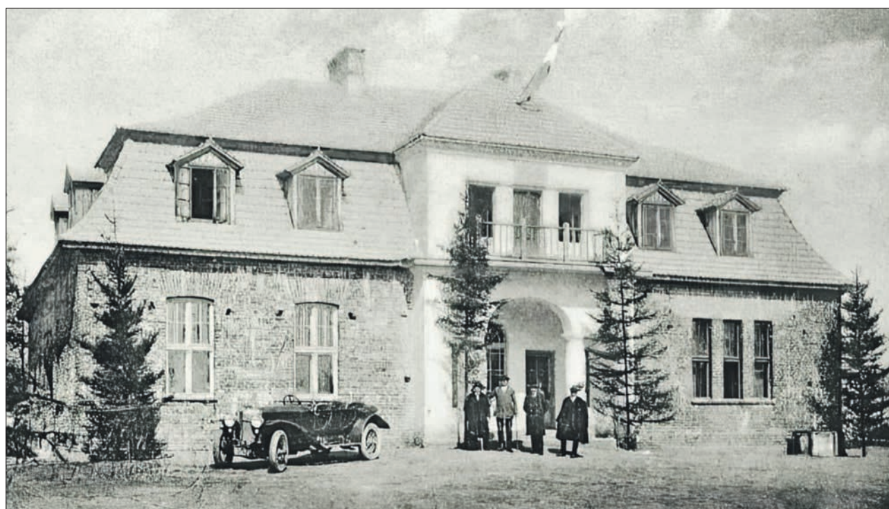
Dom Ludowy w Wierzchosławicach. Lata 1924-1930.