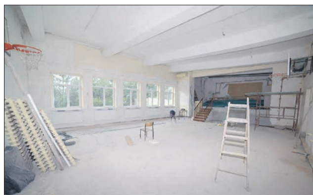
Remont hali gimnastycznej w Szkole w Ostrowie

Zakres robót budowlanych dla poszczególnych szkół obejmuje: