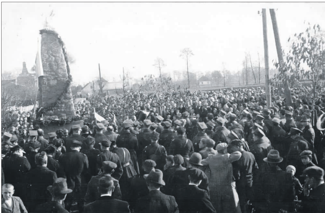
Uroczystość odsłonięcia pomnika poległych podczas I wojny światowej. Wierzchosławice 1938 rok.