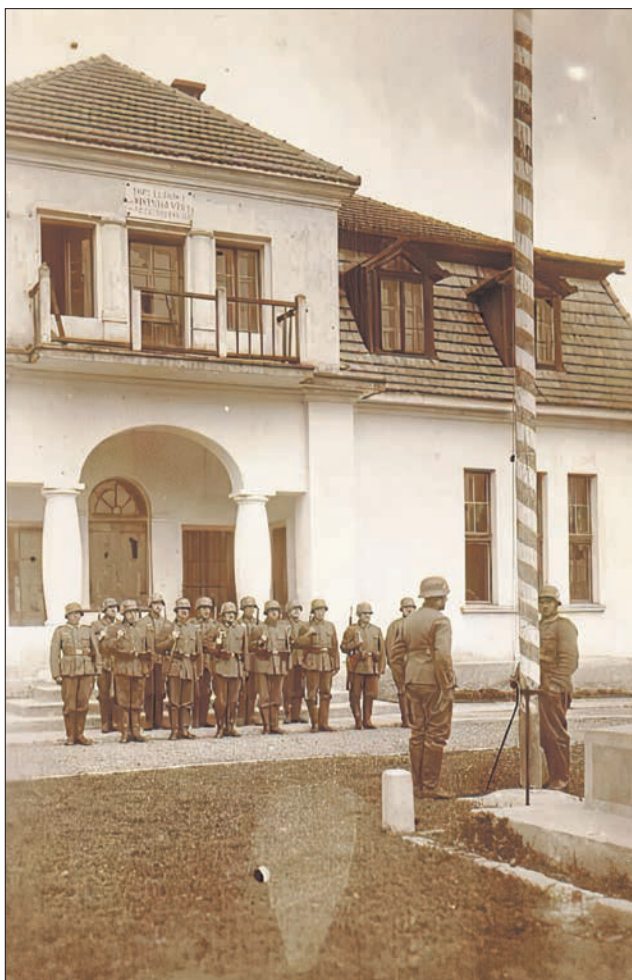
Żołnierze niemieccy przed budynkiem Domu Ludowego.