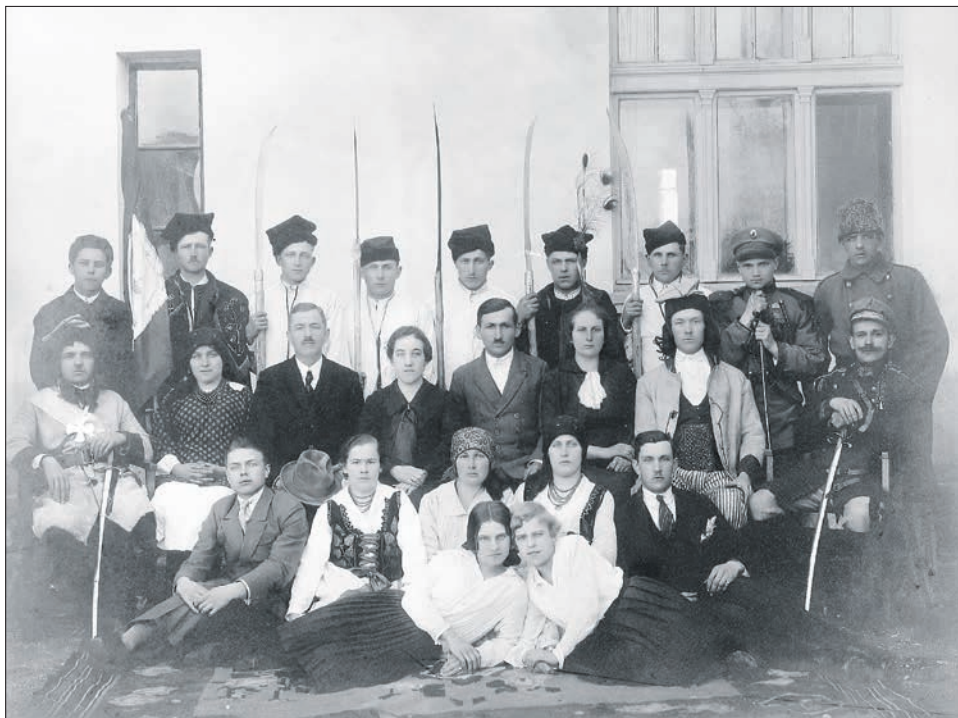
Aktorzy i kierownictwo Teatru Ludowego w Wierzchosławicach przed spektaklem „Kościuszko pod Racławicami”.