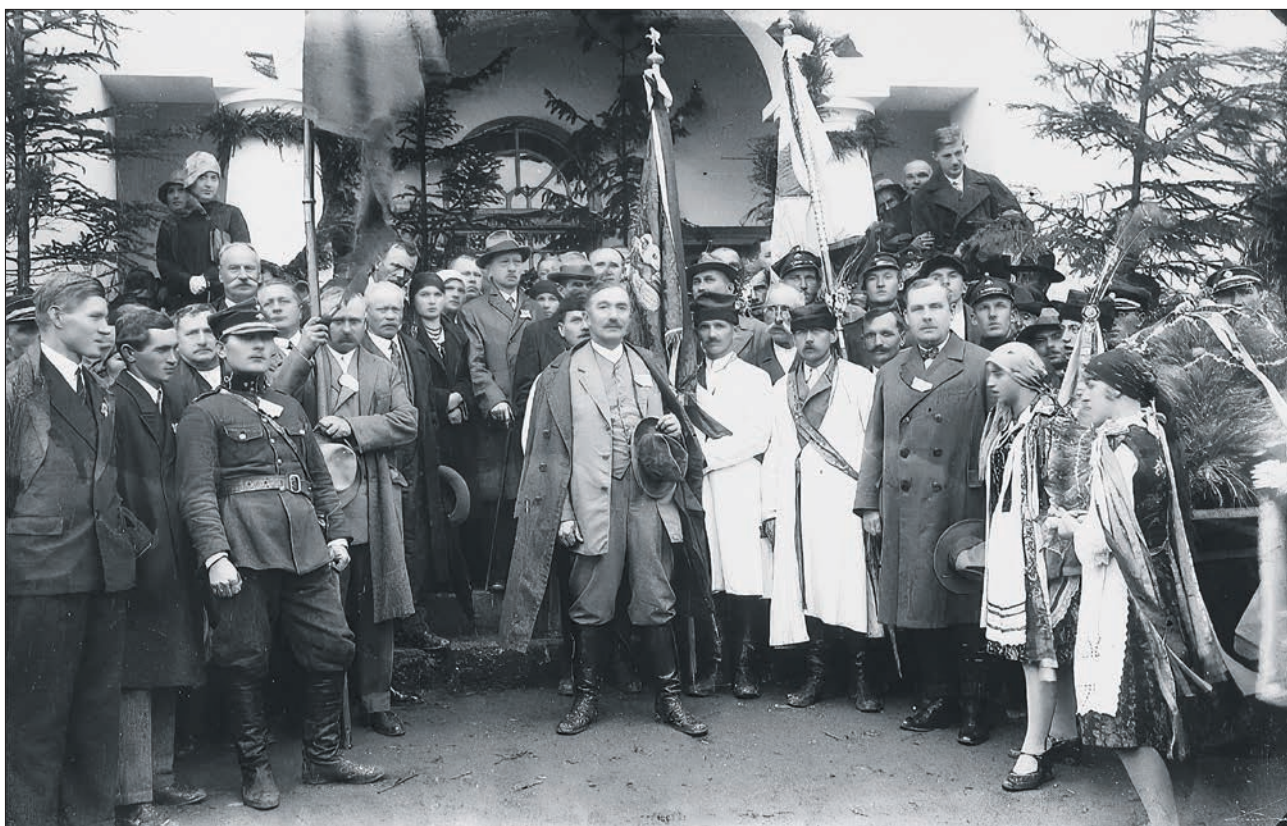
Wincenty Witos przed Domem Ludowym podczas Dożynek gminnych- 1930 rok.