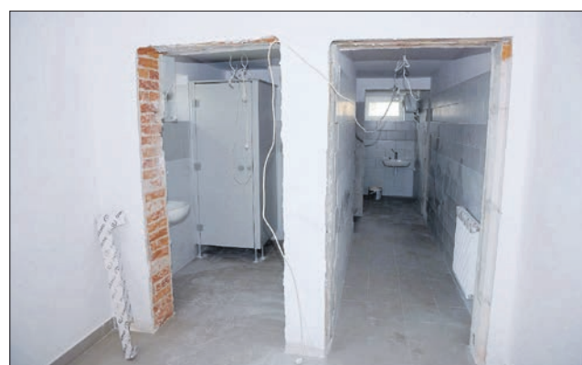
Remont Szkoły Podstawowej w Ostrowie

Również w ramach programu Polski Ład, Gmina Wierchosławice wnioskuje o fundusze, z których wykonana zostanie modernizacja placówek edukacyjnych na terenie gminy Wierchosławice. Zadanie dotyczy 6 budynków edukacyjnych. We wszystkich zostaną wykonane prace budowlane, takie jak: wymiana posadzek, okładzin ściennych, wymiana instalacji, modernizacja toalet, przystosowanie obiektu do potrzeb osób niepełnosprawnych, zakup wyposażenia, itp. Modernizacja instalacji pozwoli na obniżenie kosztów eksploatacji budynku. Dwa budynki zostaną rozbudowane.