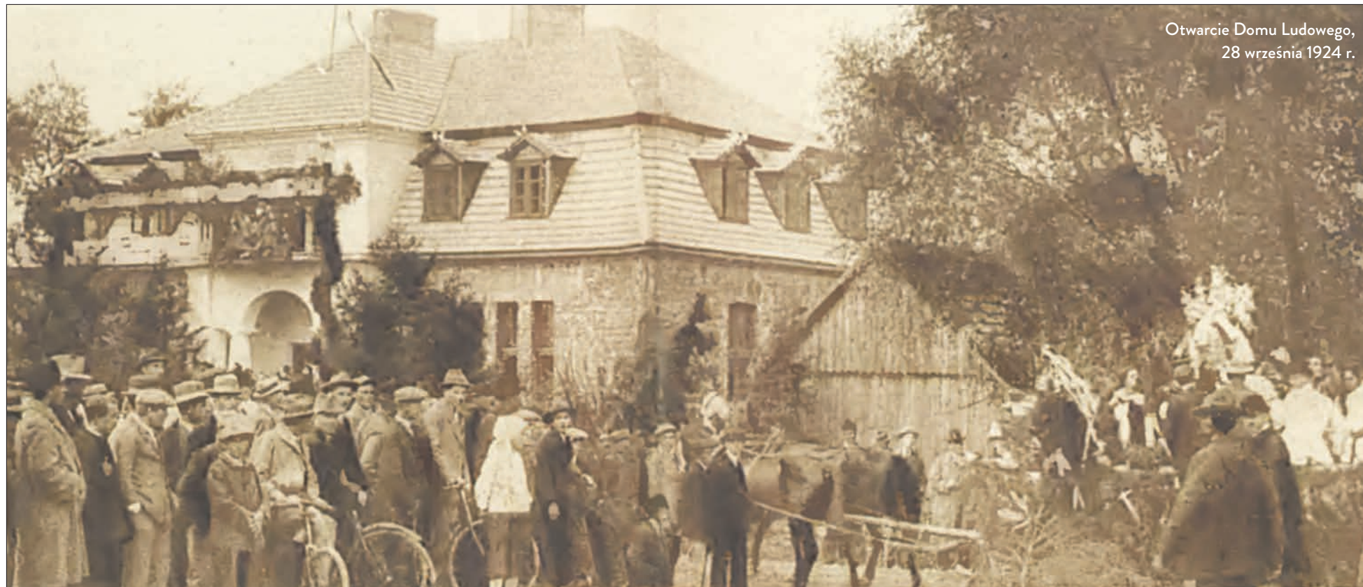
Otwarcie Domu Ludowego, 28 września 1924 r.