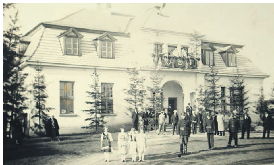
Budynek Domu Ludowego. Latach 30 XX wieku.

W wyniku rozpoczęcia budowy Domu Ludowego całkowicie przerwano prace nad budową plebanii. Rozgo-