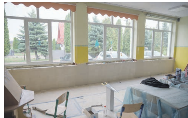
Remont szkoły w Mikołajowicach